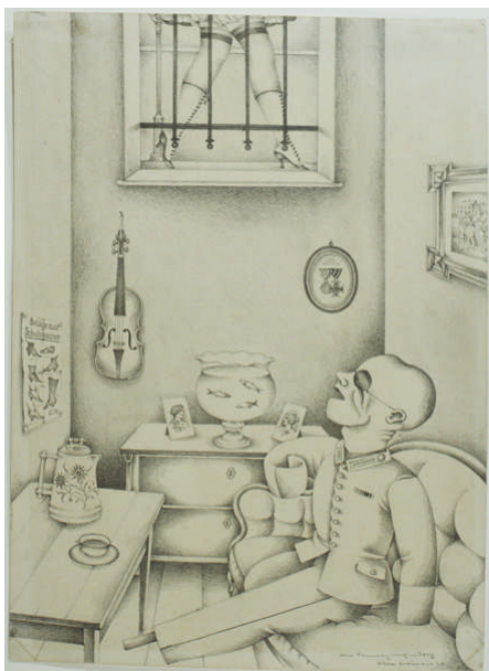
Abb.: Otto Griebel: Der Sonntagnachmittag, 1920. Städtische Galerie Dresden

Städtische Galerie Dresden Kunstsammlung